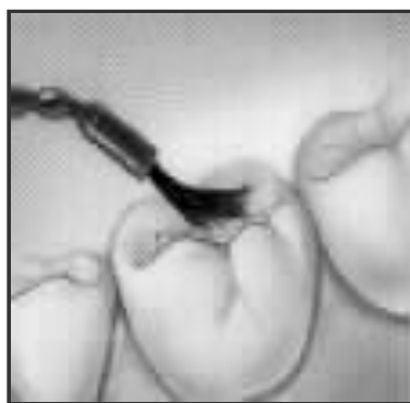
Aplicación del sellador