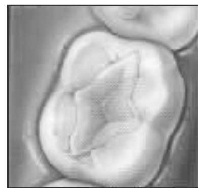
Después de aplicar el sellador